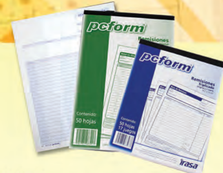
REMISION 3008020 FACTURA C/50 HJS REMISION OYKOS 300864 1/2 DUP 25 JUEGOS 300863 1/2 ORIGINAL 50 HJS 300862 1/4 DUP 25 JUEGOS 300861 1/4 ORIGINAL 50 HJS