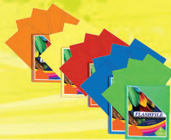
FOLDER FLASHFILE 300120 AMARILLO CARTA 300140 AZUL REY CARTA 300164 AZUL REY CARTA C/25 300110 NARANJA CARTA 300130 ROJO CARTA 300150 VERDE CARTA