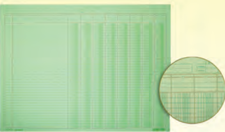
CONCEPTO 300770 3 COLUMNAS TC34034 300780 4 COLUMNAS TC34046 300800 8 COLUMNAS TC34082 300820 12 COLUMNAS TC34126