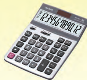
ESCRITORIO 3001207 12 DIG. DX120