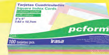
TARJETA 3X5 CUATRO C. ARCOIRIS 30002304