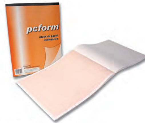
30012008 MILIMETRICO T/C C/50 HJS.