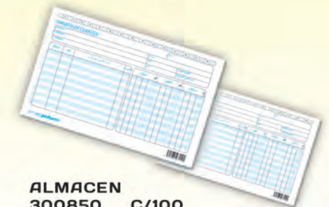
ALMACEN 300850 C/100 CLIENTES 300840 C/100