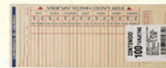
BLOCK TARJETA RELOJ CHECADOR 300621 C/100