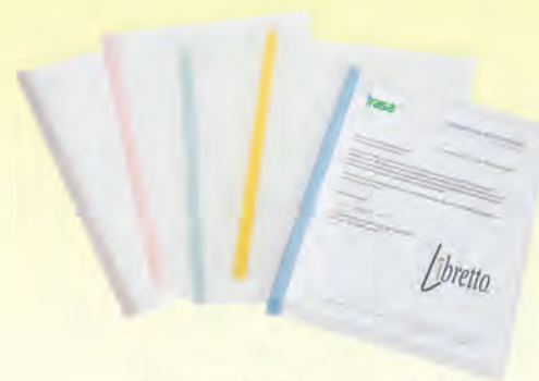
FOLDER CON SUJETADOR DE COSTILLA 3009070 C/5