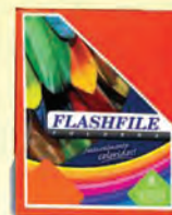
FOLDER FLASH FILE 3000463 CARTA ROJO C/25