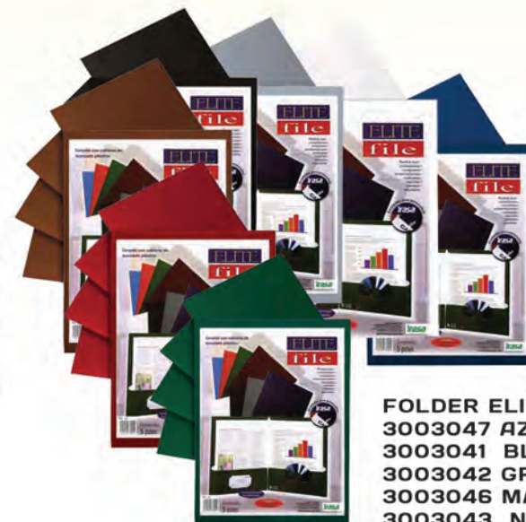
FOLDER ELITE FILE 3003047 AZUL CARTA 3003041 BLANCO CARTA 3003042 GRIS CARTA 3003046 MARRON CARTA 3003043 NEGRO CARTA 3003044 ROJO CARTA 3003045 VERDE CARTA