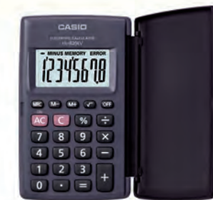
BASICA 300338 8 DIG. HL820 V 30043 8 DIGITOS HL-43