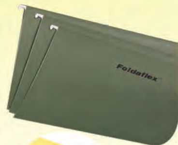
FOLDER IRASA COLGANTE VERDE