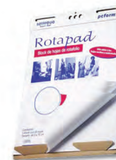
3000340 ROTAFOLIO C/25 HOJAS 64.3 X 78 CMS