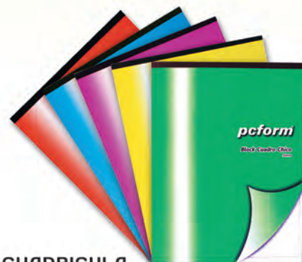
CUADRICULA 30012319 5X5 T/C 80 HJS. 12319 30012320 7X7 T/C 80 HJS. 12320