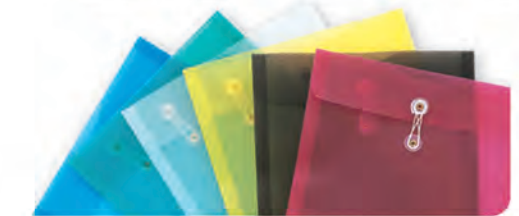
SOBRE PLASTICO C/HILO T. CARTA LIBRETTO 30093604 AMARILLO 30093601 AZUL 30093605 HUMO 30093602 ROJO 30093606 TRANSPARENTE 30093603 VERDE T. OFICIO 30093701 AZUL