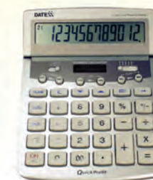
ESCRITORIO 3009222 12 DIG DD-9222