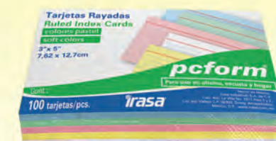
TARJETA 3X5 RAYADA C. ARCOIRIS 3002247