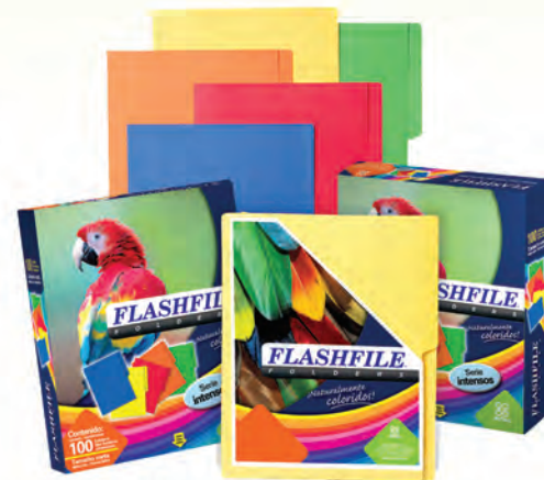
FOLDER FLASHFILE BITONO 30021619 T/C NARANJA 30021632 T/C ROJO 30021655 CTA VERDE 30021644 AZUL