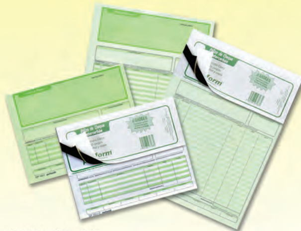
CHEQUE POLIZA 300630 # 1011 1/2 OFICIO DU PLIC. 300640 # 1013 CARTA DUPLIC. 300290 INTERCARBON 1/2 OFICIO 300300 INTERCARBON CARTA