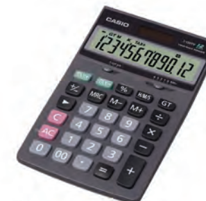
ESCRITORIO 300340 12 DIG. J120 TV