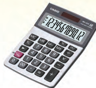
BASICA 300339 12 DIG. MX-120