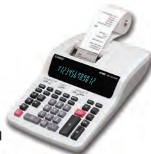
IMPRESORA 300342 12 DIG. DR120LB