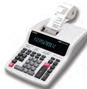
IMPRESORA 3002106 12 DIG. C/IMP DR210