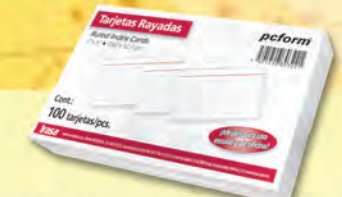
TARJETA BIBLIOGRAFICA BLANCA 300310 3" X 5" 300312 4" X 6" 300314 5" X 8"