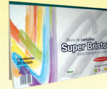
3006999 BLOCK CARTULINA SUPER BRISTOL C/25 HJS