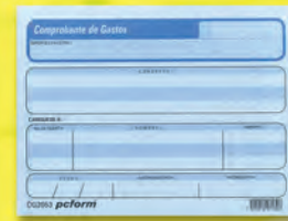
300700 COMPROBANTE DE GASTOS #2053