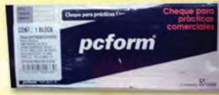
3005011 CHEQUE PARA PRACTICAS COMERCIALES C/50 LINEA AZUL