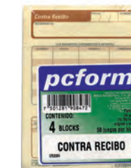
300720 CONTRA RECIBO CR20646 1/4 DUPLICADO 50 JGS