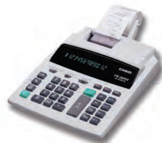
IMPRESORA 300343 12 DIG. FR2650-A