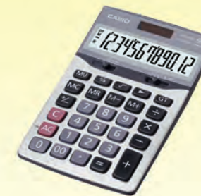
ESCRITORIO 3001208 12 DIG. AX-120