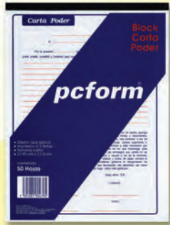
300540 CARTA PODER #7205-A 50 HJS.