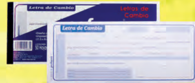
3008605 LETRA DE CAMBIO C/50 HJS