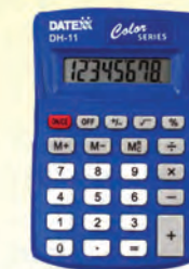
DATEXX 300345 8 DIG. BASICA DH11C8