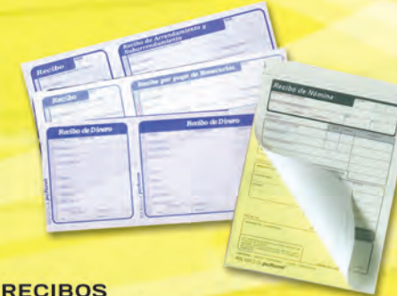
RECIBOS 3008015 ARRENDAMIENTO C/50 HJS 3008013 HONORARIOS C/50 HJS 300510 DINERO 6105-A 300670 NOMINA RN20127 DUPL. 1/4