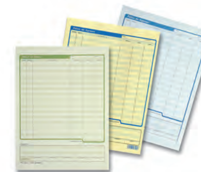
POLIZA 300610 DIARIO 300499 EGRESOS 300620 INGRESOS