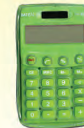
DATEXX 300346 8 DIG. BASICA DH60C3