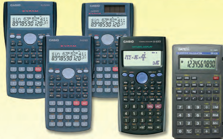
CALCULADORA CASIO CIENTIFICA 10/2 DIG.