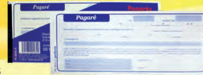
PAGARE 300531 #8600A 50HJS 300530 #PA8600 100HJS