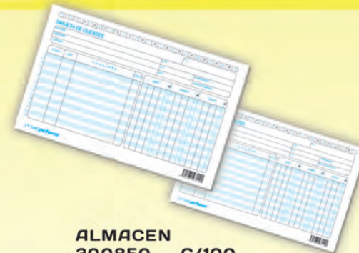
ALMACEN 300850 C/100 CLIENTES 300840 C/100