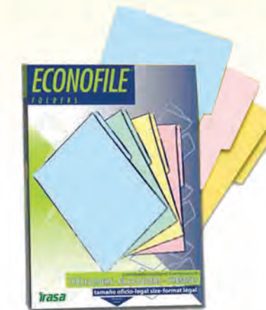
FOLDER RECICLA 100 ARCOIRIS COLORES P/50 300851